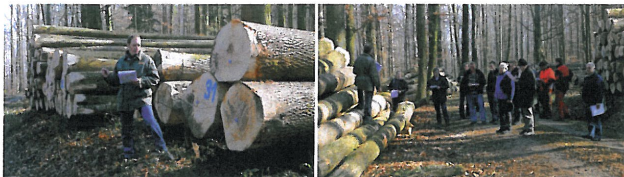
Holzsteigerung Frühjahr 2012